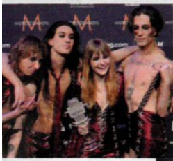
I Måneskin, ovvero Thomas, Ethan, Victoria e Damiano vincitori dell'Eurofestival

Pochi italiani sono arrivati primi all'Eurovision dopo aver vinto il Festival di Sanremo, e comunque portavano con sé un'immagine poco innovativa, basti pensare a Toto Cotugno e anche, un buon numero di anni fa, a Gigliola Cinquetti: di fatto andavano a promuovere la musica italiana più che il proprio personaggio.