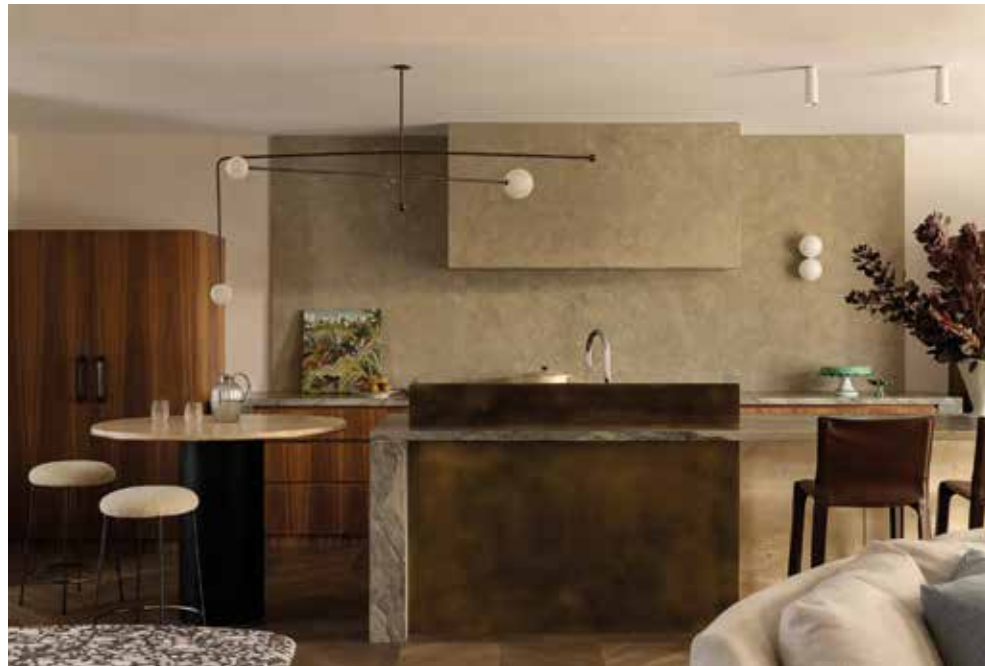
BRAHMAN PERERA, Holbrook House