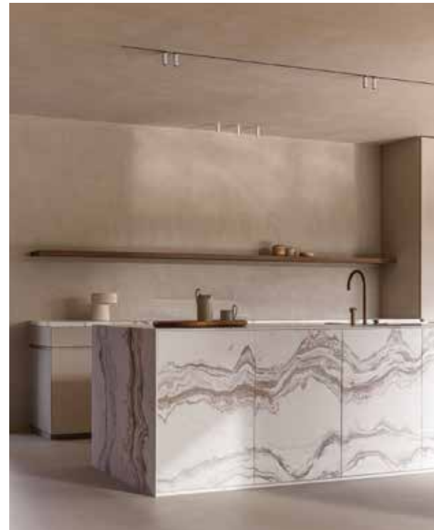
POTIER STONE, Produced by ville.design using Alta Marea natural stone © Cafeine.be - potierstone.be