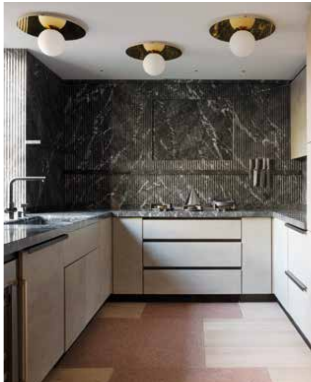
CEA DESIGN, Soho triplex, Studio Razavi

From tabletops to drawer and cabinet fronts or complete room cladding, this year natural stone transforms kitchens into eye-catchers: luxurious and timeless. Using clever techniques like varying marble thickness or adding supports, Potier Stone makes even the most sophisticated designs possible. Imagine subtle lighting behind natural stone, using glass or plexiglass as a base to achieve a unique and atmospheric look. The result? A kitchen that is not only functional, but also a paragon of craftsmanship and individuality. ▷