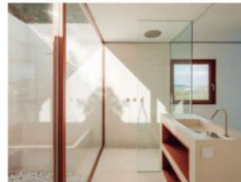
Colecciones: Asta + Free Ideas Productos CEA: AST08 (x2) + FLX06AS + FRE40S