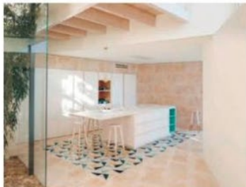
Colecciones: Asta + Free Ideas + Accesorios Productos CEA: AST20S + FLX04WS + DOS04S

Arquitectura: Caballero Colón, Paula Caballero García y Diego Colón de Carvajal Salís Ubicación: Canyamel, Mallorca (España) Nombre de la colección: Asta + Ideas libres + Accesorios