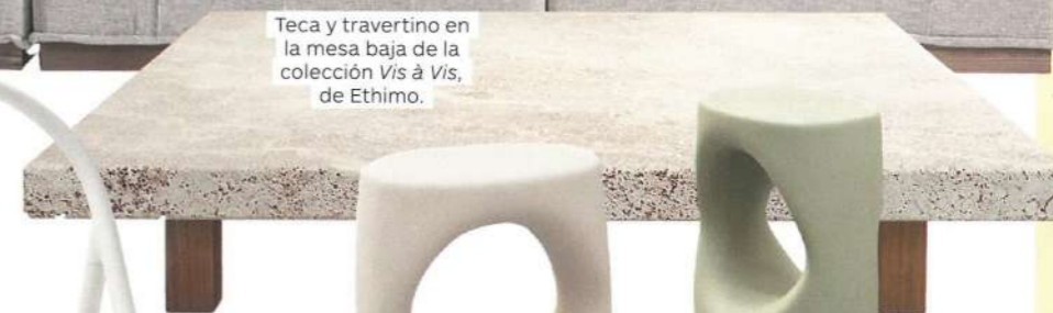
Teca y travertino en la mesa baja de la colección Vis à Vis , de Ethimo.