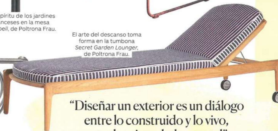
El arte del descanso toma forma en la tumbona Secret Garden Lounger , de Poltrona Frau.

“Diseñar un exterior es un diálogo entre lo construido y lo vivo, entre lo mineral y lo vegetal”.