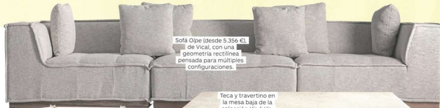
Sofá O/pe (desde 5.356 €), de Vical, con una geometría rectilínea pensada para múltiples configuraciones.