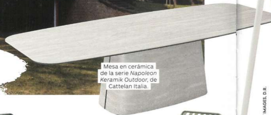
Mesa en cerámica de la serie Napoleon Keramik Outdoor , de Cattelan Italia.

Una invitación a una pausa sensorial gracias a las líneas suaves, las paletas neutras y unos acabados que transmiten SERENIDAD y equilibrio.