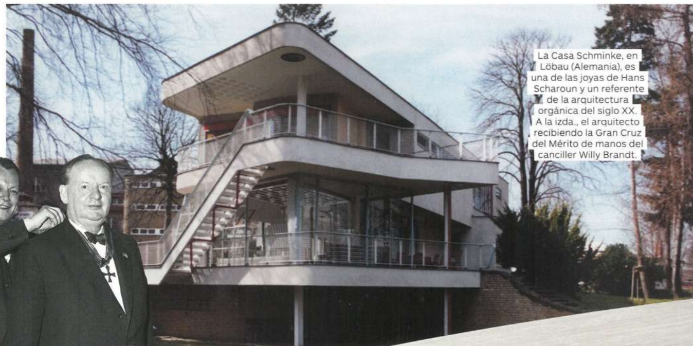
La Casa Schminke, en Löbau (Alemania), es una de las joyas de Hans Scharoun y un referente de la arquitectura orgánica del siglo XX. A la izda., el arquitecto recibiendo la Gran Cruz del Mérito de manos del canciller Willy Brandt.