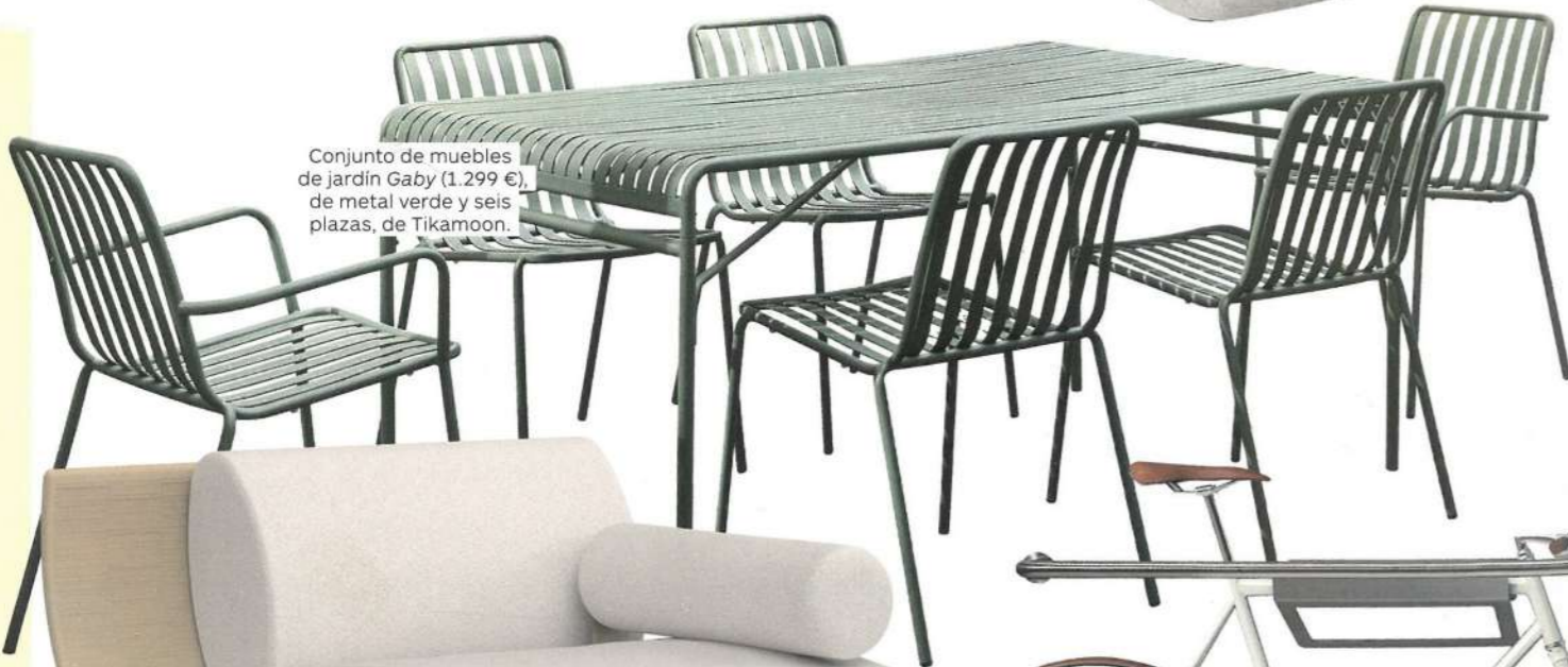
Conjunto de muebles de jardín Gaby (1.299 €), de metal verde y seis plazas, de Tikamoon.