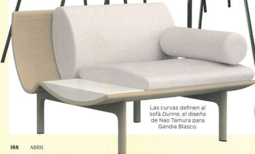
Las curvas definen al sofá Dunne , el diseño de Nao Tamura para Gandia Blasco.