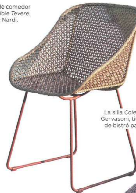
La silla Colette , de Gervasoni, tiene aire de bistró parisino.