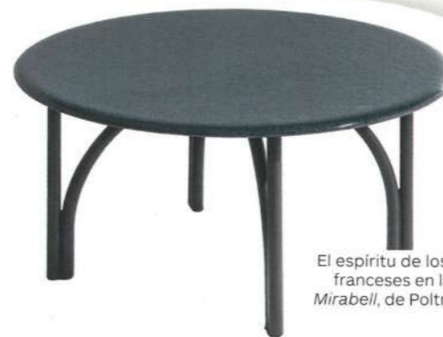
El espíritu de los jardines franceses en la mesa Mirabell , de Poltrona Frau.