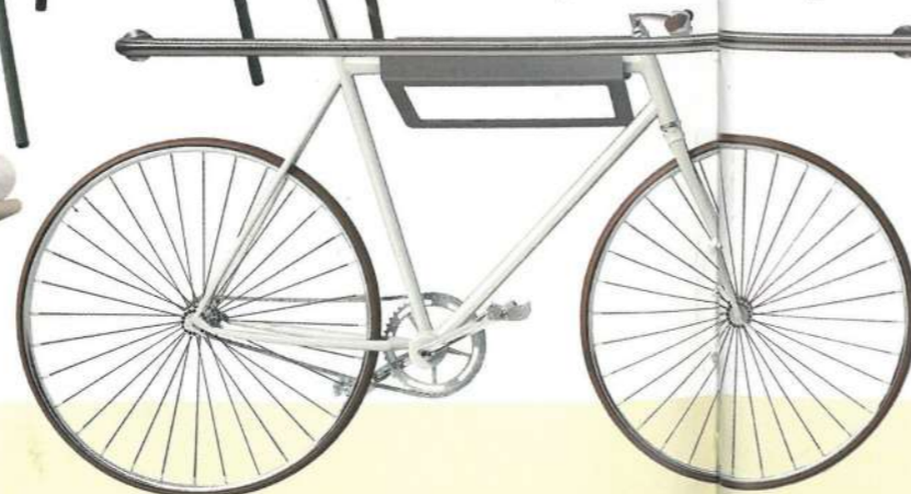
Hook , de Ceadesign, redefine la grifería con un diseño modular en acero.