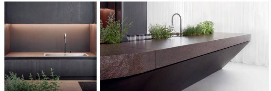
Dynamic shapes achieved through a few essential elements that mix geometry, matter and precious textures.