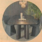
TAVOLO D'EBANO PER BONALDO Bonaldo presenterà al Salone la nuova finitura in ebano dall'effetto elegante e scultoreo del Geometric Table Wood disegnato da Alain Gilles