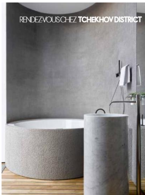
RENDEZ-VOUS CHEZ TCHEKHOV DISTRICT

A l'intérieur également, les architectes et les propriétaires des lieux (des Russes) ont privilégié les formes rondes et matricielles, le design des grands créateurs des années 60 et de nombreuses œuvres d'art modernes, dont une sculpture aérienne de Calder. Au sol du grand salon, la céramique effet marbre noir strié rappelle les salles des plus prestigieuses musées du monde et contraste avec les tonalités neigeuses qui dominent dans cette décoration. Le noir et blanc, du moins le contraste entre certains matériaux sombres et le mobilier de couleur claire, est plus que jamais d'actualité et sûr de son élégance. ■