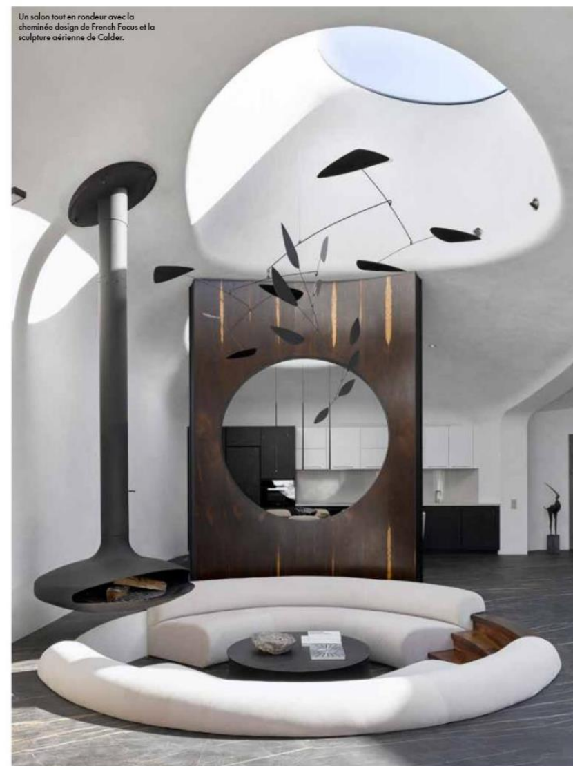
Un salon tout en rondeur avec la cheminée design de French Focus et la sculpture aérienne de Calder.