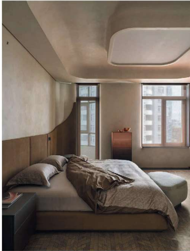
1. Гостевой санузел. Смесители Fantini. 2. Гостиная спальня, которую можно будет трансформировать в детскую при возможном расширении семьи заказчицы. Кровать и стеновые панели Shake. Комод De Castellì. Пуф Piet Boon. 3. Фрагмент коридора. Справа: Ванная при гостевой комнате. Сантехника и смесители CEA Design. Перегородка из цветного стекла Tibi Italia.

«Мебель повторяет обтекаемые формы интерьера. Каждый предмет — произведение искусства».