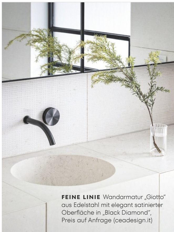
FEINE LINIE Wandarmatur „Giotto“ aus Edelstahl mit elegant satiniertes Oberfläche in „Black Diamond“, Preis auf Anfrage ( ceadesign.it )